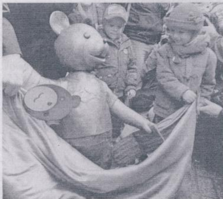
Dzieci tarmosiły misia za klapnięte uszko

Podczas sobotnich uroczystości w Łodzi dla najmłodszych zorganizowano również warsztaty animacji oraz pokaz filmów. Nie zabrakło także pluszowych Uszatków, przypinek z podobną misia oraz charakterystycznych masek.